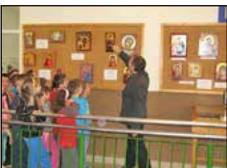
Iskolai színes hírek 8-9. oldal