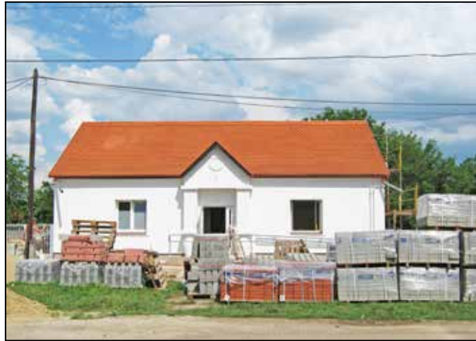
Hamarosan befejeződik az orvosi rendelő felújítása, parkoló építése

A költségvetésben meghatároztuk az idei év fejlesztéseit is, melyek