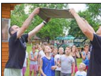
Sportra fel! 11. oldal