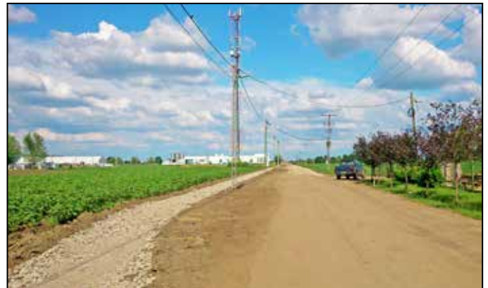
Elkezdődött az ipartelepre kivezető út stabilizálása és járdaépítés

Ha az elmúlt évi gazdálkodást összehasonlítjuk a korábbi évek zárszámadásával, milyen azonoságok és különbségek jellemzik leginkább a gazdálkodást?