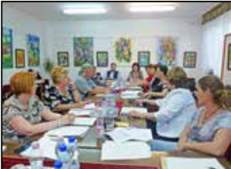
Beszámoló a képviselő-testület üléséről – 3. oldal