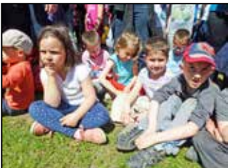
Nagypark átadó 6. oldal