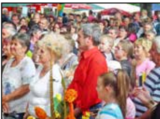
Majálisoztunk 6. oldal